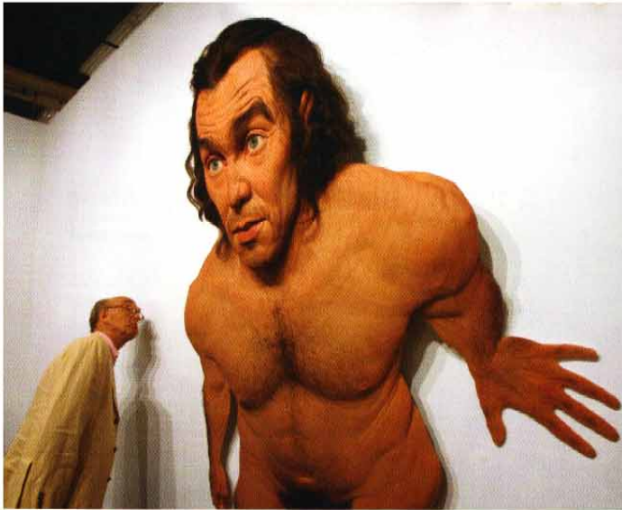
„Art Basel“: Evan Pennys Skulptur „Aerial #2“ bei der Galerie Sperone Westwater